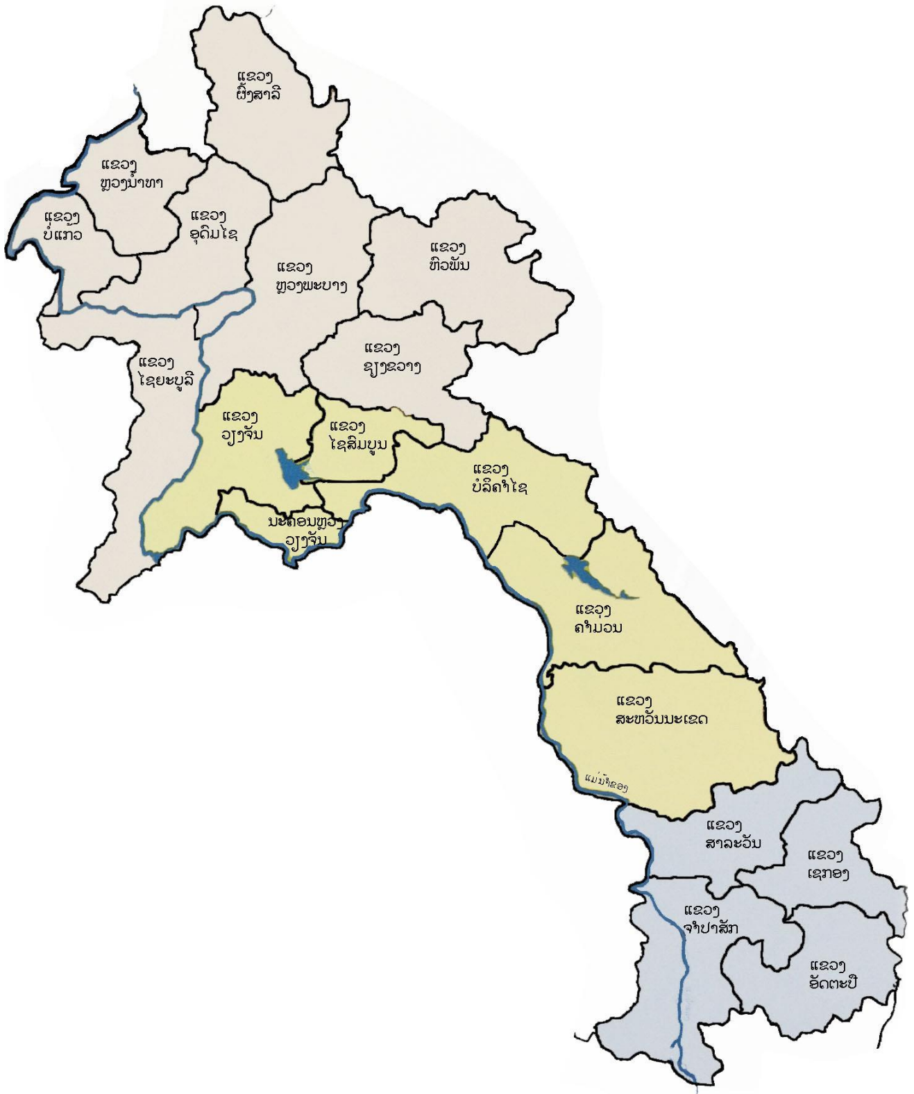
ແຜນທີ່ມີແຂວງໄຊສົມບູນ

ຂໍ້ມູນໃໝ່ ບົດທີ 11 ໜ້າທີ 29 ແຜນທີ່ປະເທດລາວ, 2017