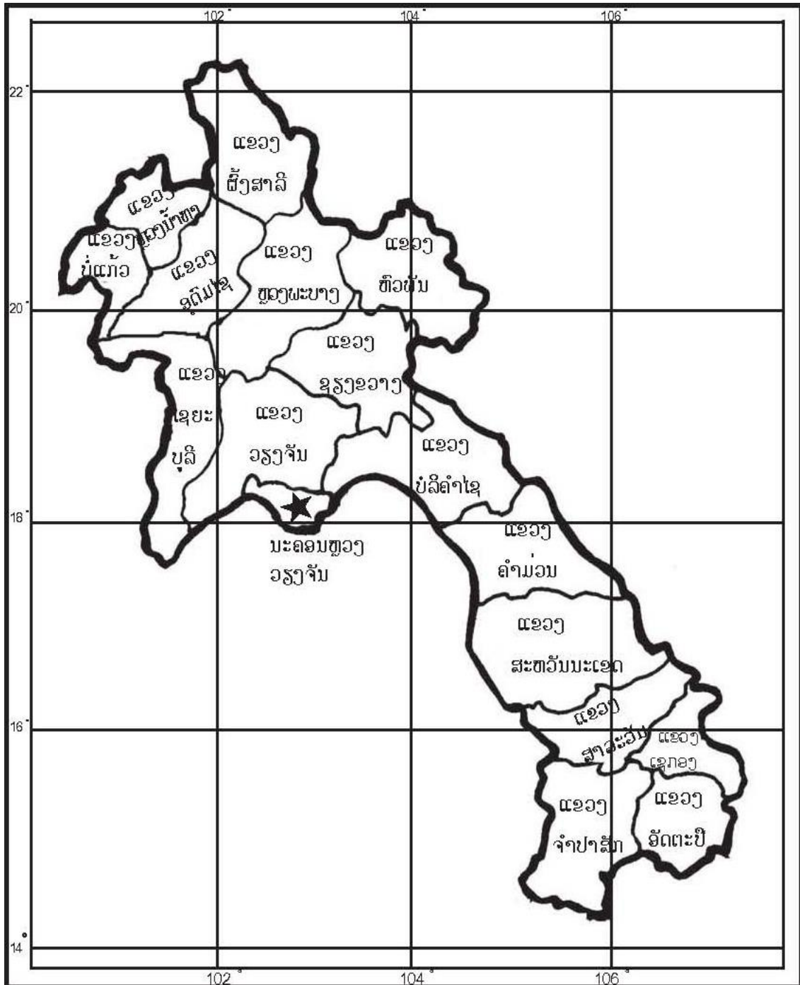
ແຜນທີ່ບໍ່ມີແຂວງໄຊສົມບູນ

ຂໍ້ມູນເກົ່າ ບົດທີ 15 ໜ້າທີ 79 ແຜນທີ່ປະເທດລາວ, 2009